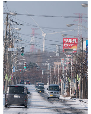
花川北中からま近に見える風車