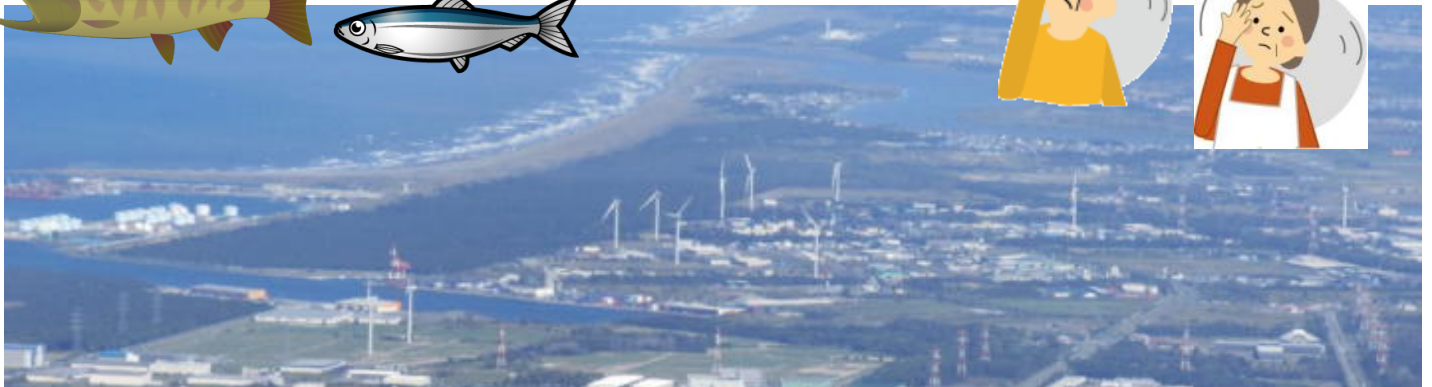
石狩湾岸に建設されている風車群-手稲山からの眺望